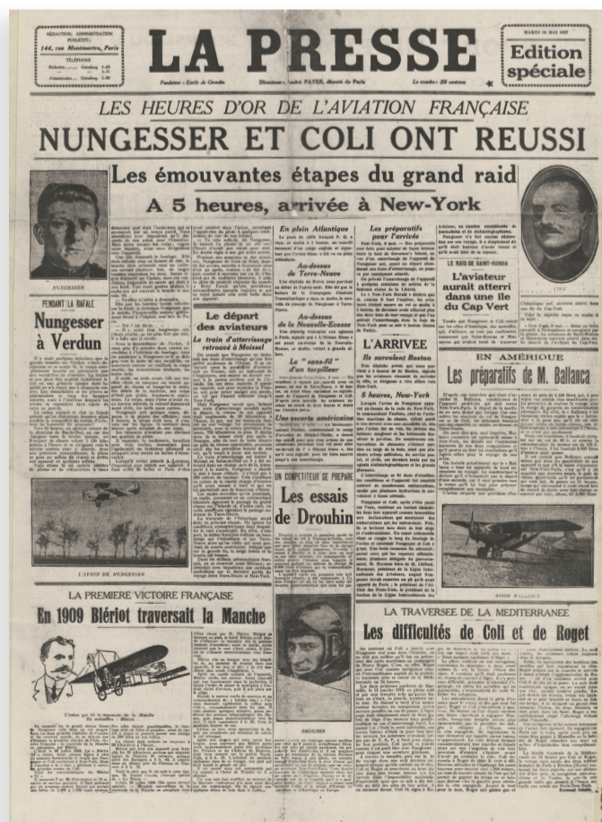
La Presse, 10 mai 1927

Le 10 mai 1927, La Presse , voulant créer le buzz, annonce en une le succès de la traversée de l'Atlantique en avion par Nungesser et Coli. Les ventes explosent. Or les deux hommes ont tragiquement disparu... Discredité par ce faux scoop, ce journal voit ses ventes progressivement chuter. Il disparaît définitivement en 1935, après huit années de parutions irrégulières.